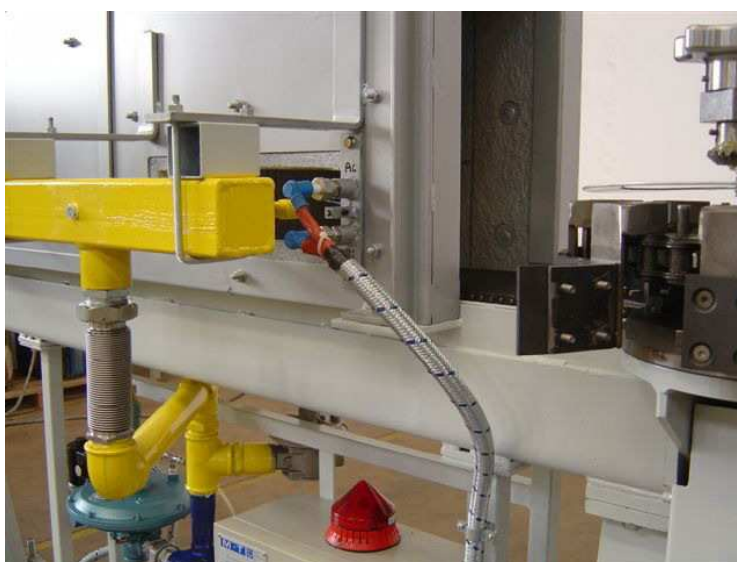
Esecuzione speciale del nastro trasportatore con muffola isolata e sistema di riscaldamento laterale con bruciatori radianti