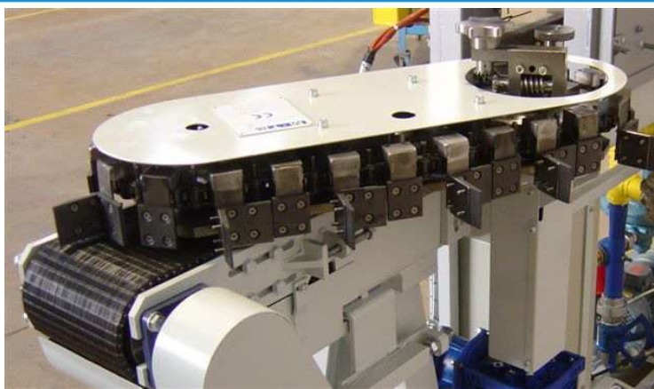
Montaggio di ruota di trasferimento da 72"