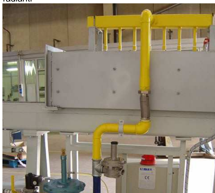
Esecuzione speciale del nastro trasportatore con muffola isolata e sistema di riscaldamento superiore con bruciatori radianti